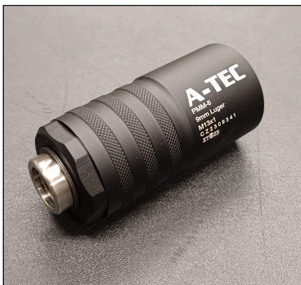
obr. č. 1