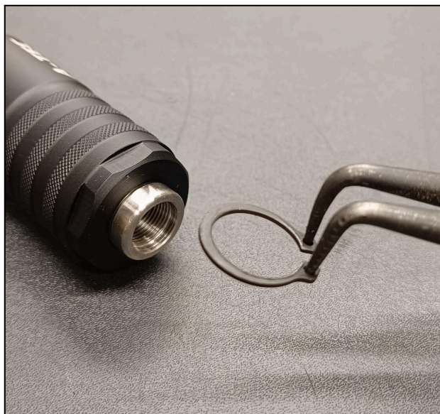
obr. č. 3