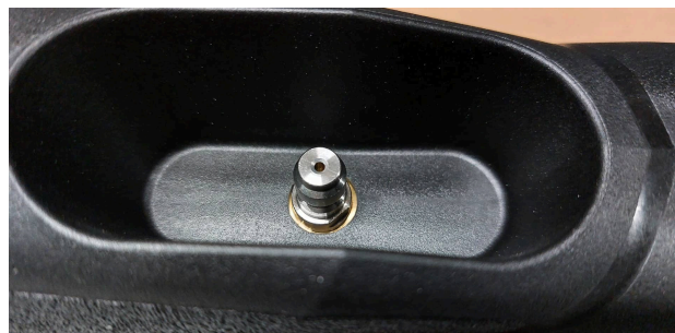
PLNICÍ PIN ZABUDOVANÝ VE ZBRANI

Chcete-li pušku vybit, odjistěte zbraň, poté zatáhněte za nabíjecí páku do její úplné zadní polohy a při jejím držení pomalu stiskněte spoušť a zároveň páku vraťte dopředu dokud se nevrátí do úplné přední polohy.